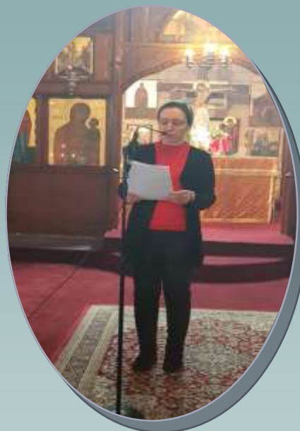
Ε.Π.Σ. Αγ. Ελευθέριου