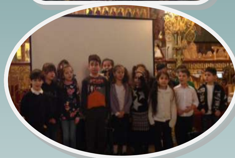
Ε.Π.Σ. Αγ. Ιωάννη