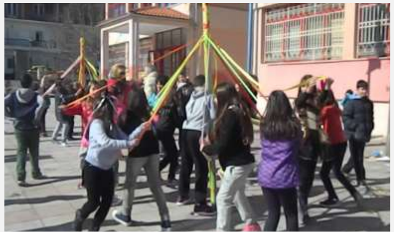
“Το γαϊτανάκι», παραδοσιακό παιγνίδι της Τσικνοπέμπτης

The red colour has been established on that day, meat or wine, to remind us the joy of Easter.