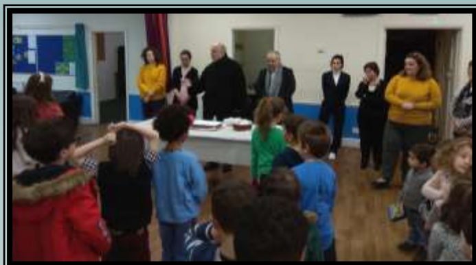
Ε.Π.Σ Αγ. Ελευθέριου, Leyton